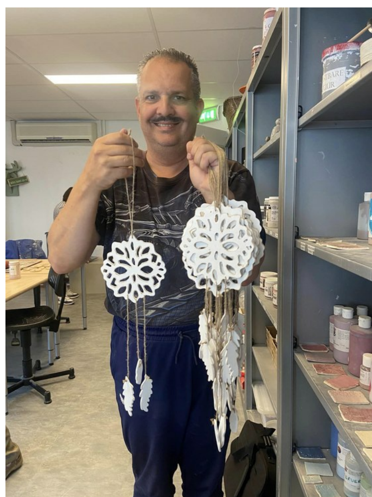
Inspiratie voor nieuwe, handgemaakte producten bij de Wissel in Harderwijk.