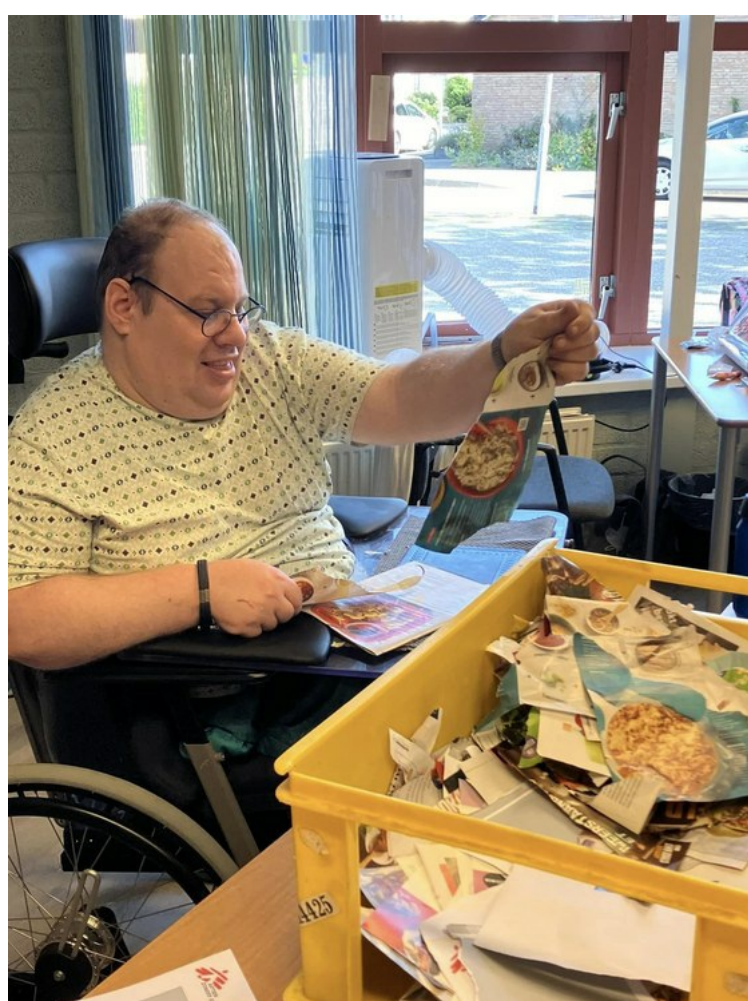
Bij Shalom in 't Harde zitten ze na de vakanties weer vol energie en nieuwe plannen.